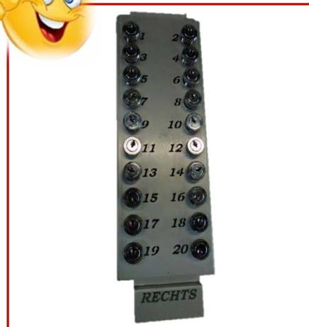
BU-B Produktion Ymago Schlösser Blech 2. Rang