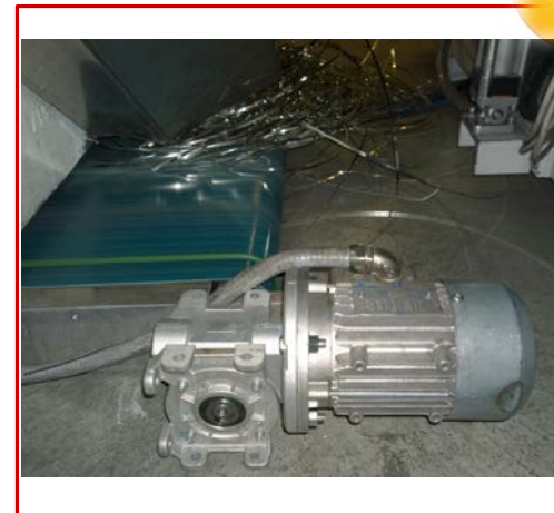
Verpackungen Getriebe Rollenschere 3. Rang